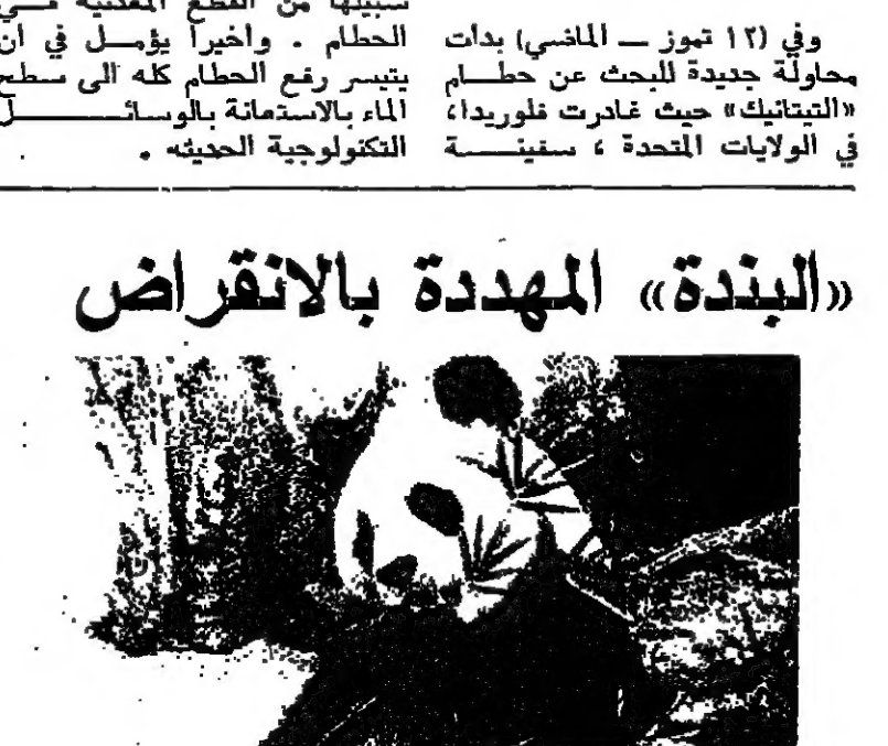
البندة الجامعة تنتظر المساعدة

البندة من الحيوانات الثديية الضخمة التي تنتمي الى فصيلة البنية . ولم يبق من هذه الحيوانات في موطنها الاملاسي مقاطعة «سينشوان» الصينية اكثر من ١٠٠٠ بندة أصبحت معرضة للانقراض بسبب جرماتها من غذائها النباتي المنضج الذي يعرف بالخيزران الخليلي . ففي الاجراج التي تعيش فيها البندة البرية تتربوا على اشجار الخيزران مؤخرًا وبدأت تموت الان . وهذا النبات غريب وفريد في نوعه من حيث انه يزهر مرة كل مائة سنة تقريباً وعلى اثر ذلك يموت بنتالدى ولكن يخلّف بذوره في التربة لينمو جيل جديد من نبات الخيزران فيعيش ويزدهر هو